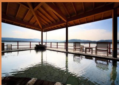
ゆったり天然温泉 日帰り入浴!