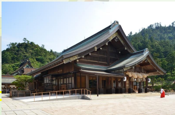
出雲大社 (イメージ)

各地—出雲(昼食)— 出雲大社 (自由参拝/約1時間30分滞在)—各地—備北バス本社19:00頃